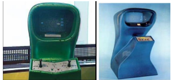
Computer Space, primeiro fliperama da história.

O primeiro jogo de fliperama chamou-se Computer Space e foi lançado em 1971. Logo