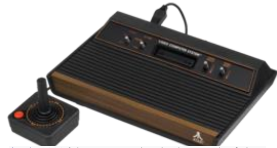
Atari 2600 foi um console de jogos eletrônicos popular no final dos anos 1970 e início dos anos 1980.

O jogo eletrônico, videogame ou videogame é aquele que usa a tecnologia de computador. Ele pode ser jogado em computadores pessoais (dentre eles tablets e telefones celulares), em máquinas de fliperama ou em consoles. Um console é um computador pequeno que serve basicamente para jogar videogame — PlayStation, Xbox e Wii são exemplos. Os consoles são conectados a controles manuais e a um aparelho de televisão. As pessoas podem jogar tanto sozinhas quanto acompanhadas.